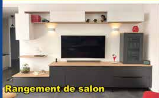
Rangement de salon

NOUVEAU ! Conseils & réalisation Agencement Intérieur