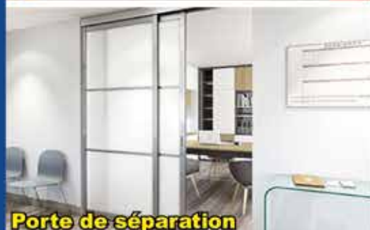
Porte de séparation